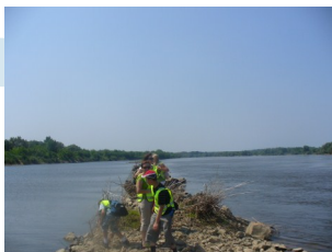
Wisła widok z tamy wojskowej.

Po pobycie nad tamą zwiedzamy miejscowość Józefów.