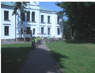
Pałac – siedziba władz gminy.

Józefów nad Wisłą wieś gminna położona w województwie lubelskim, w powiecie opolskim. Miejscowość słynąca z otaczających ją sadów owocowych. Położona nad Wisłą stanowi ciekawe miejsce widokowe i rekreacyjne. Zatrzymać się tu możemy w gospodarstwach agroturystycznych, by popłynąć kajakiem, zjeść świeżo złowioną rybę. Miejscami, które warto zobaczyć są: