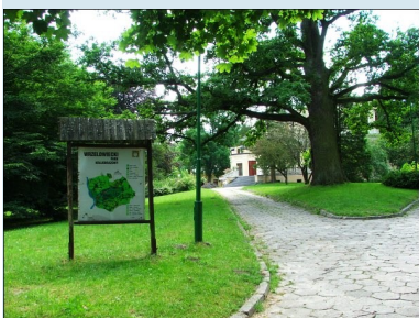
Park w Kluczkowicach

utworzono szkołę rolniczą, przekształconą następnie w Zespół Szkół Ogrodniczych. Obecna nazwa szkoły to; Zespół Szkół Rolniczych Centrum Kształcenia Praktycznego. Szkoła stanowi filię Zespołu Szkół.