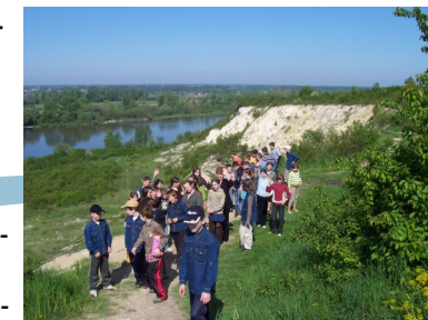
Kamieniołomy w okolicach Piotrawina foto arch. szkoły.

Fragment odkrytego wąwozu lessowego można zaobserwować na brzegu Wisły, gdzie kilkadziesiąt lat temu znajdowała się kopalnia kamienia.