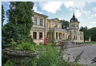
Pałac w Kluczkowicach

Miejscowość Kluczkowice jest położona w województwie lubelskim.