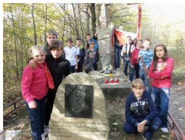
Dzieci SP Chruślina przy pomniku na „Złotej Gó- rze”.