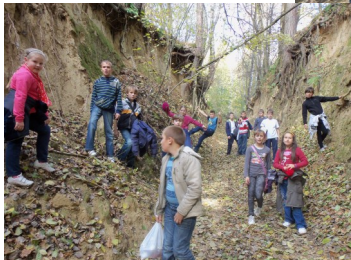
Wąwóz lessowy u podnóża Złotej Góry.