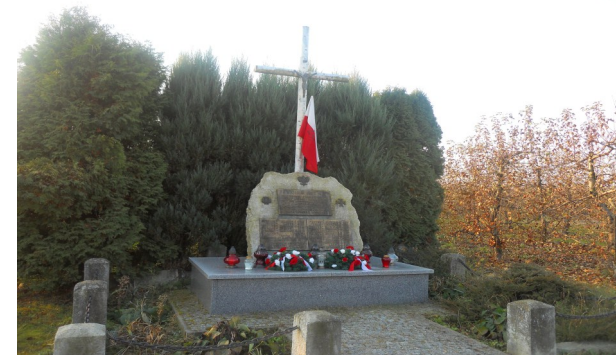
Pomnik poległym partyzantom

Na pamiątkę wydarzeń w Owczarni stanął pomnik upamiętniający bratobójczą walkę między oddziałami partyzanckimi. Pomnik składa się z białego i wysokiego krzyża oraz kamiennego cokołu, na którym umieszczone są trzy tablice. Na tych tablicach są nazwiska zamordowanych żołnierzy Armii Krajowej. Obok krzyża powiewa biało-czerwona flaga. Pomnik jest często odwiedzany przez rodziny żołnierzy i historyków, którzy chcą poznać i upamiętnić historię.